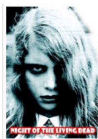
Night of the Living Dead