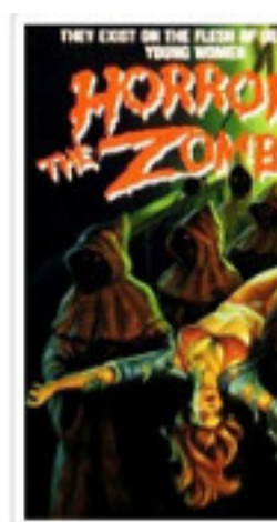
Horror of The Zomb... (The Ghost...)