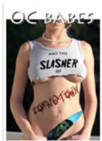
OC Babes and the Slasher of Zomb...

ogni tre mesi. Come si può leggere chiaramente nel documento ufficiale, la "tassa" è diretta specificamente a "portali e siti che offrono opere cinematografiche o audiovisive".