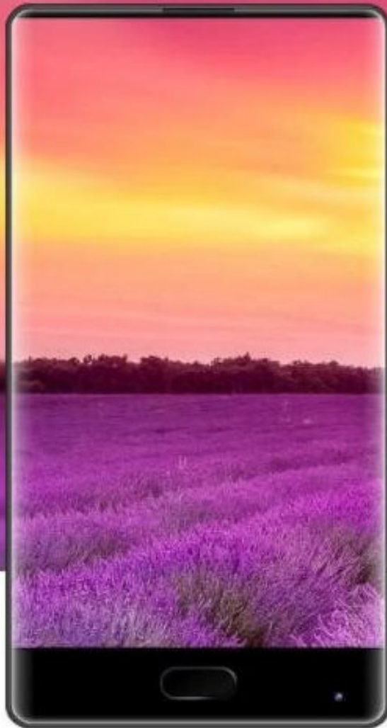
DOOGEE MIX 5.5" (16:9 ratio)