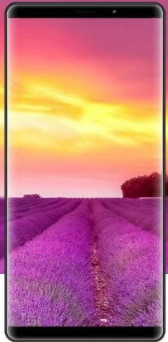
DOOGEE MIX 2 5.99" (18:9 ratio)

Doogee MIX 2: il nuovo smartphone con il display a schermo intero